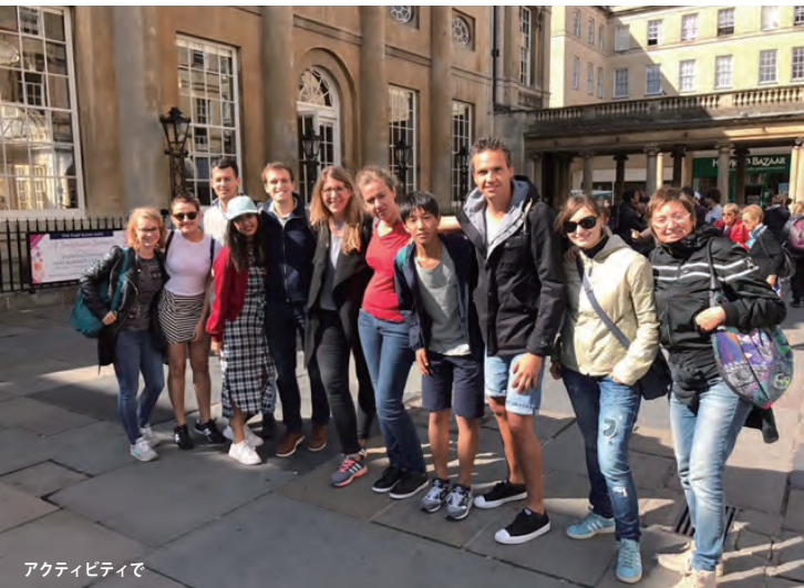
アクティビティで