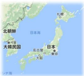
サイズは北海道くらい