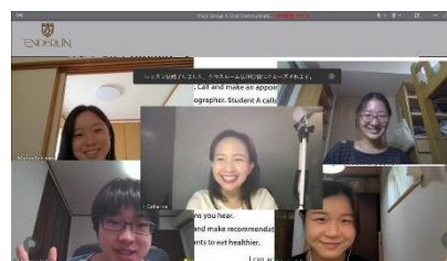
※2022年度参加学生からの提供写真