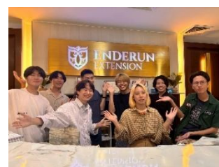
過去の参加学生からの提供写真