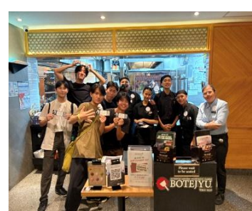
※過去の参加学生からの提供写真