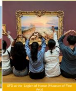
SFD at the Legion of Honor (Museum of Fine Arts)