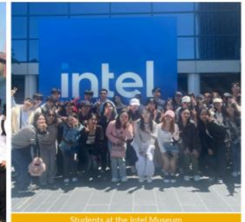
Students at the Intel Museum