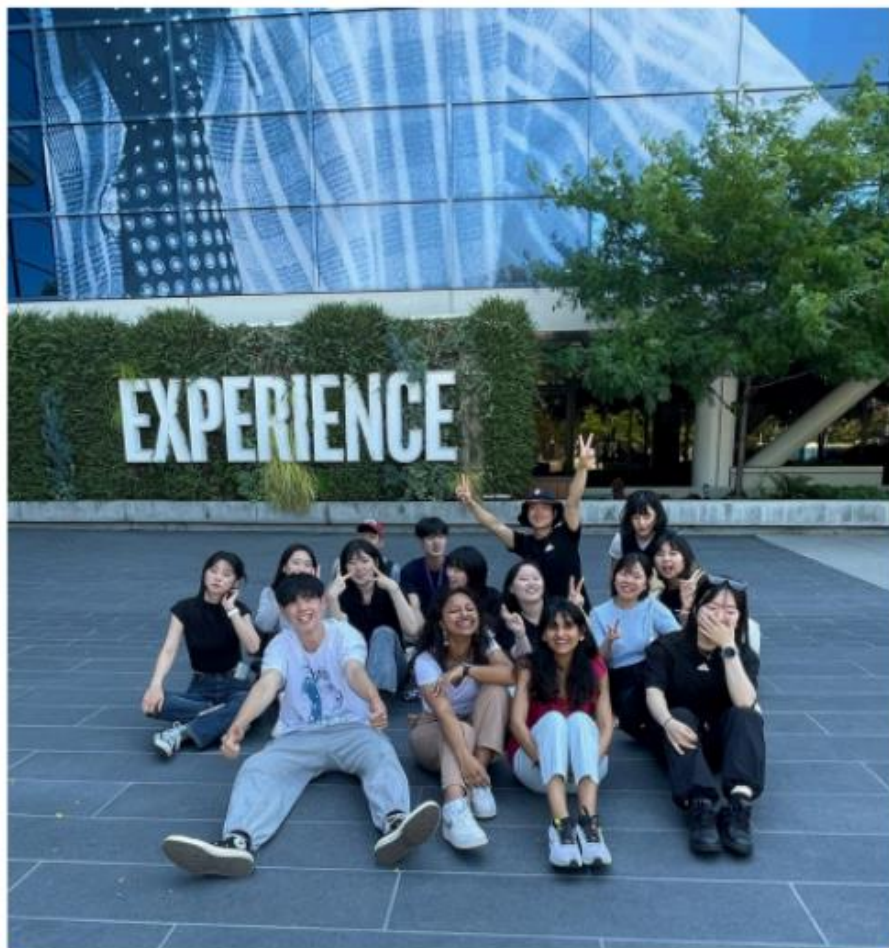
Experience San Francisco Discover