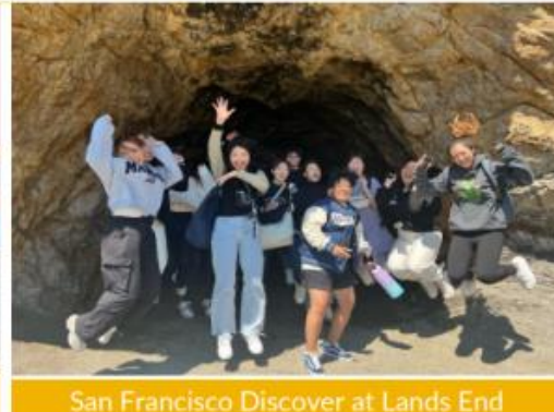
San Francisco Discover at Lands End